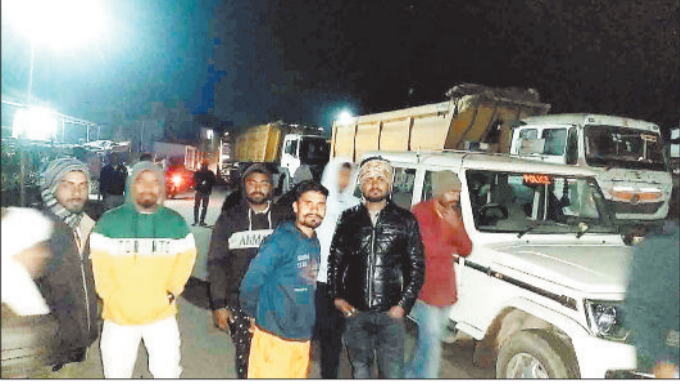
प्रदर्शन करते क्षेत्र के लोग।