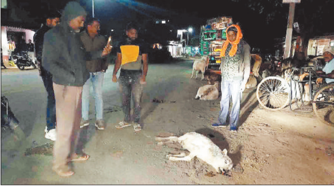
दुर्घटना में मृत मवेशी।